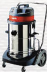
جارو برقی صنعتی