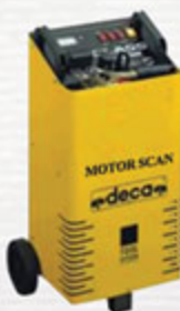
شارژر و استارتر باطری