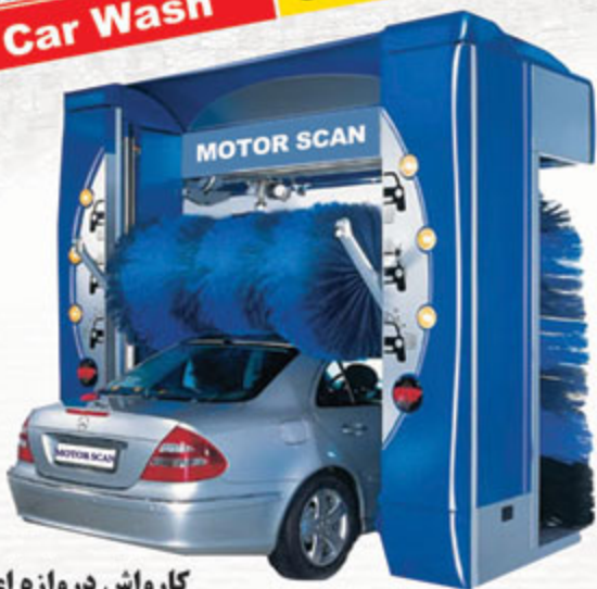
کارواش دروازه ای