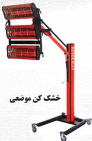
خشک کن موضعی