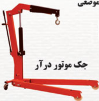
جک موتور در آر