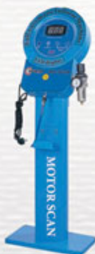
تنظیم باد دیجیتالی